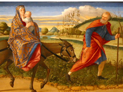
La fuite en Egypte, Vittore Carpaccio, NGA of Washington