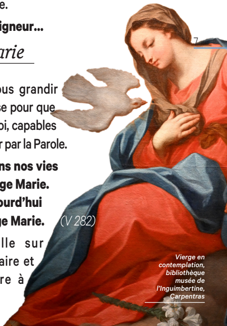
Vierge en contemplation, bibliothèque musée de l'Inguimbertaine, Carpentras

1. Vierge Marie, veille sur notre équipe du Rosaire et aide chaque membre à